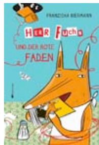
Franziska Biermann Herr Fuchs und der rote Faden

„Herr Fuchs mag Bücher“, erstmals 2001 erschienen und über 12.000 mal verkauft, wurde 2002 ausgezeichnet mit dem Troisdorfer Bilderbuchpreis . Nachdem das beliebte Buch längere Zeit nicht lieferbar war, erscheint „Herr Fuchs mag Bücher“ nun im mixtvision Verlag , zusammen mit dem neuen Nachfolgebild „Herr Fuchs und der rote Faden“.